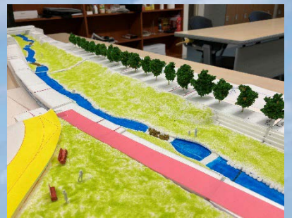
多自然川づくりを考慮した 低水路の設計（模型設計）