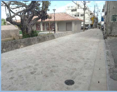
琉球石灰岩を利用した 石張り舗装設計