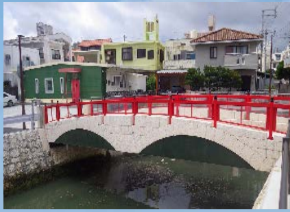
地域の歴史に配慮した 橋梁景観設計